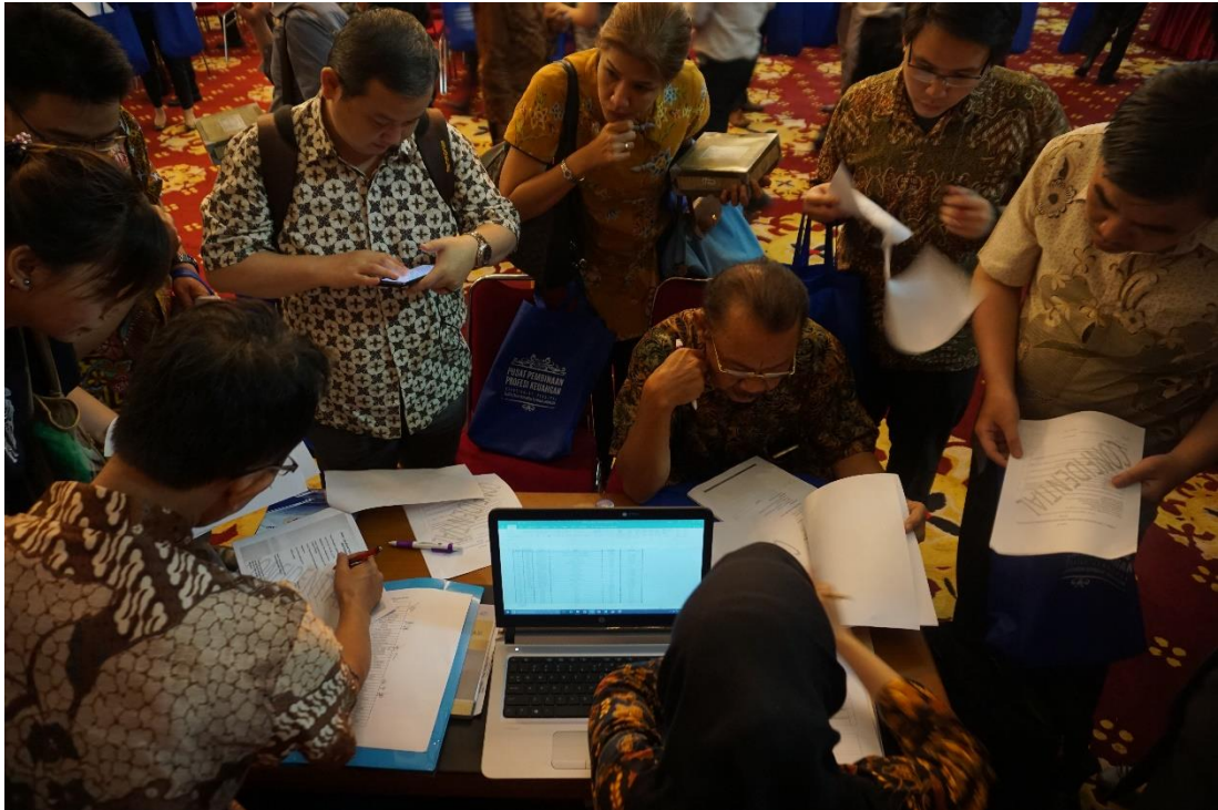
(Foto pelaksanaan pendaftaran di booth ASEAN CPA dalam acara outreach program di Jakarta)

profesi akuntan tersebut. Dari pelaksanaan kegiatan tersebut dapat diperoleh gambaran bahwa para profesi akuntansi di beberapa tempat yang dilakukan kegiatan sosialisasi sangat antusias dan mendukung akan penerapan ASEAN MRA on Accountancy Services.